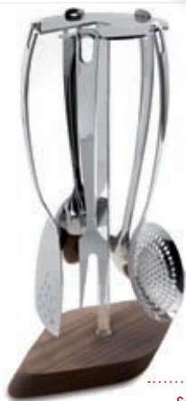
set 5 utensili 5 pc kitchen tools set 5 pièces ustensiles 26 x 15 x 40 H cm