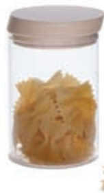
barattolo ermetico jar with hermetic lid bocal rond hermetique Ø 11 x 20 H cm - 1,5 lt