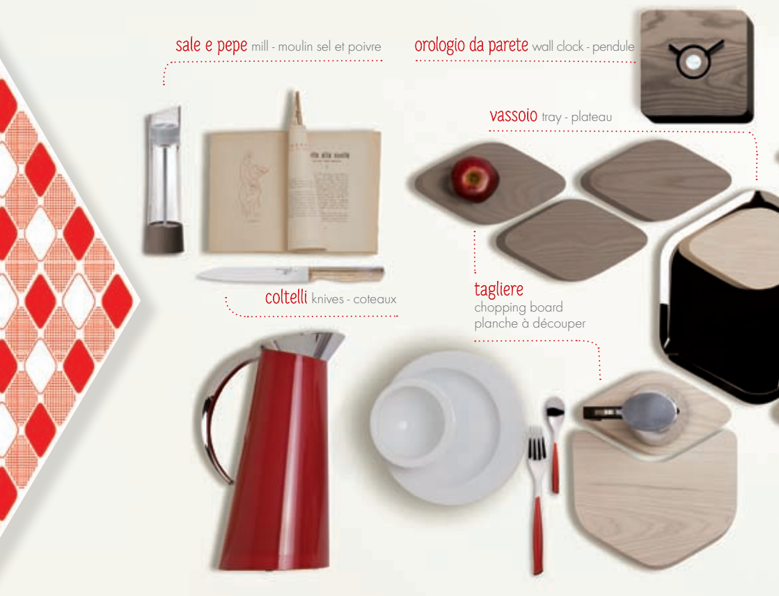
sale e pepe mill - moulin sel et poivre