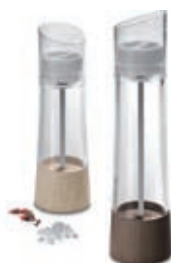
macina sale e pepe salt & pepper mill moulin sel et poivre Ø 6 x 18/22 H cm