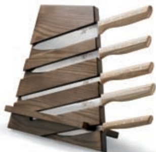
ceppo coltelli multifunzione Multifunction knives block Bloc à couteaux multifonctionnel 38 x 15 x 33 H cm